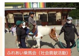
ふれあい乗馬会(社会貢献活動)

生命保険事業に関する理解促進および金融(保険)リテラシー教育の一翼を担うことを目的として、全国各地の大学において「生命保険実学連続講座」を実施しています。地元の地方事務局長が主たる講師として豊富な実務経験を踏まえた授業を行っており、時には学生から社会人の先輩として相談を受けて親身に話を聴くなどしながら、真摯に講義運営を行っています。