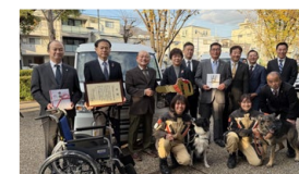
福祉巡回車・車椅子・災害救助犬の寄贈