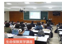
生命保険実学講座