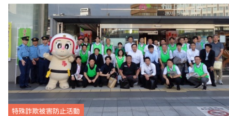
特殊詐欺被害防止活動