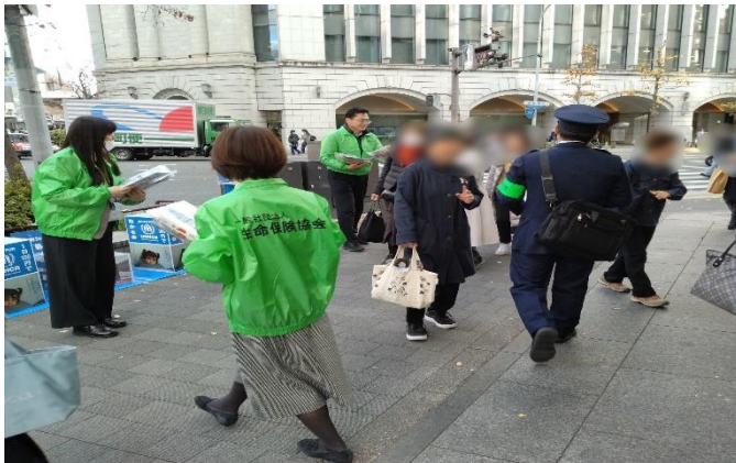
街頭 PR（チラシ・ティッシュ等配布）活動の様子 （京都府協会）